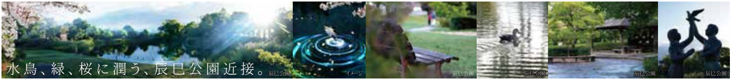
水鳥、緑、桜に潤う、辰巳公園近接。辰巳公園 イメージ 辰巳公園 辰巳公園 辰巳公園 辰巳公園

※距離表示については現地からの地図上の概測距離を、徒歩分表示については80mを徒歩1分として算出(端数切り上げ)したものです。※掲載の写真は2023年10月に撮影し、CG加工をしたものです。