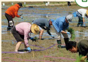
田んぼに異なる品種の苗を植えて絵を描く「田んぼアート」の田植えを行いました