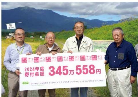
10月、田んぼアートの前で寄付金贈呈式を開催。組合員から生産者への応援メッセージもお渡ししました

佐渡トキ応援お米プロジェクトでは、「CO・OP産直 新潟佐渡 コシヒカリ」やその加工品の売り上げの一部を「佐渡市トキ環境整備基金」に寄付し、生きものを育てるための環境づくり・トキと共生するお米づくりに役立てています。佐渡は島特有の気候で夏場は比較的涼しく、稲穂がじゅっくりと実るため、独特の甘みとコク、粘りのあるおいしいお米が育ちます。このおいしいお米を食べることが、生産者の応援につながります。