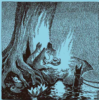
《ムーミン谷の彗星》1946年 ©Moomin Characters™