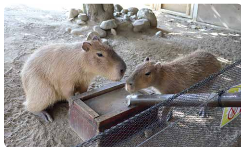
アルバカ・ヌマガメ（5～10月限定）・ニホンザル・カピバラ・ヤギ・ヒツジのエサやり体験ができます。（各100円。販売数に限りがあります）