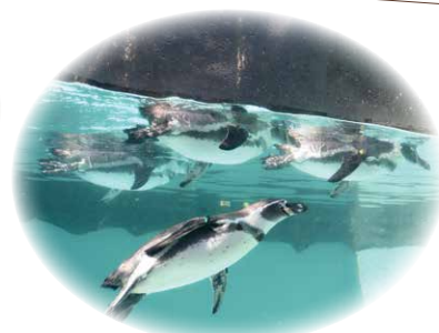
▲人気のフンボルトペンギンたち。泳いでいる姿が見られます！