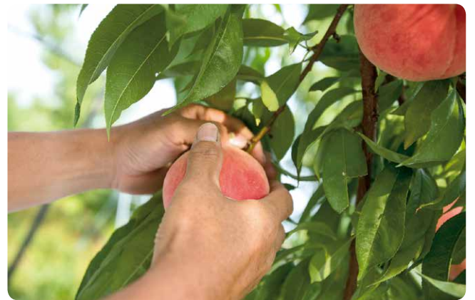
やさしく傷付けないように収穫しています