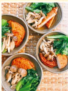
ちょきちょきさん (51歳)

レタスの外葉を「さつま揚げときのこのさっと煮」に。火の通りの早い彩り野菜と思ってきれいなところを選んで洗って使います。たまごのスープにもレタスの外葉を仕上げに入れて火が通ると鮮やかな緑に。