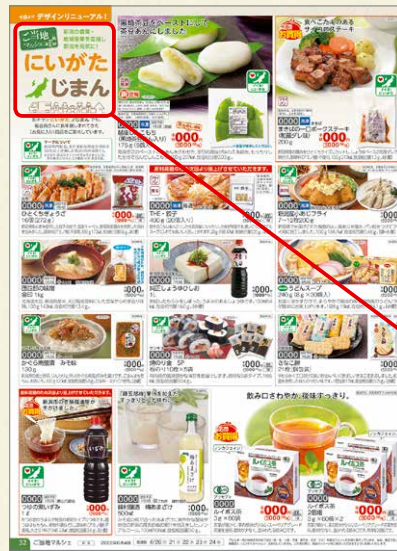
「ハピ・デリ！」誌面イメージ