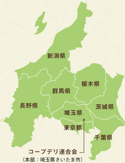
コープデリ連合会 (本部：埼玉県さいたま市)