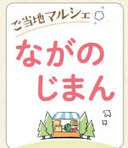
「ご当地マルシェ」ロゴ。各生協ごとに異なります

コープデリ連合会は、今後も会員生協の組合員の皆さまのくらしに貢献できるよう、 事業と活動に取り組みます 。1都7県のコープが手をとりあって、 今までできなかったことも、共同の力で実現 していきます。 設立30周年にあわせて、 今後キャンペーンを行う予定 です。お楽しみに！