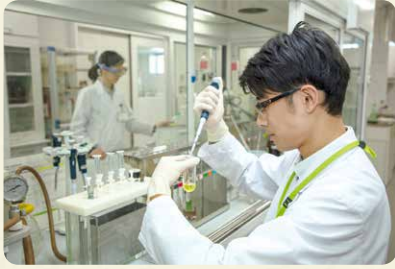
商品検査センターは、フードチェーン全体での食の安全の取り組みが機能していることを、科学的・客観的に確認しています