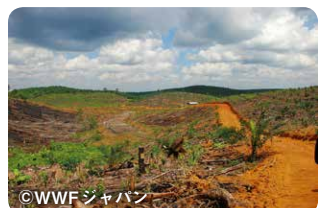
インドネシア・西カリマンタン州では、パーム油の原料となるアブラヤシ農園を作るために熱帯林が伐採されています

世界では、1990年以降、推定4億2千万ヘクタールもの森林が減少したとされています。これは、日本の約11倍の広さの森が失われたということです。その原因はさまざまですが、私たちのくらしもその一つ。日々利用する木材や紙、そして食品や洗剤などに使われる「パーム油(植物油脂)」などの生産が、時に世界の森林破壊の要因となっているからです。 森林は、私たちに資源をもたらすだけでなく、水の供給源であり、多くの生き物のすみかであり、地球温暖化につながる二酸化炭素(CO 2 )を吸収してくれる存在でもあります。 豊かな森を未来につ