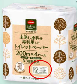
CO-OP 未晒し原料を再利用したトイレットペーパー