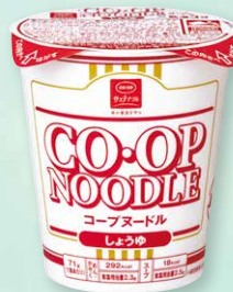
CO-OP コープヌードル しょうゆ

コープデリグループは、事業と活動を通して「SDGs (持続可能な開発目標)」の達成を目指しています。