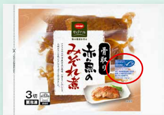
CO-OP 骨取り赤魚のみぞれ煮