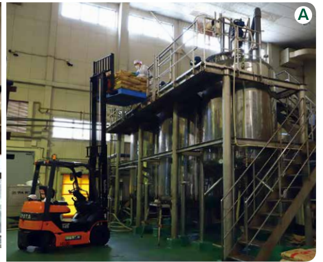
調合室。大量生産に対応するための巨大なタンクが並んでいます(写真A)。ビン詰め作業に入る前に、ビンを洗浄してから使用します(写真B)。規定の量になるように充填し、ふたをしていきます(写真C)。