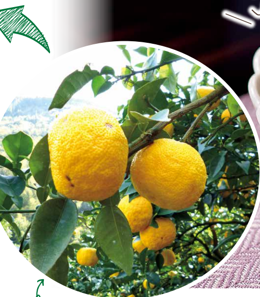
日本有数の産地である高知県産のゆず。ゆずの収穫は年に一度。収穫したら搾った状態で冷凍保存しています