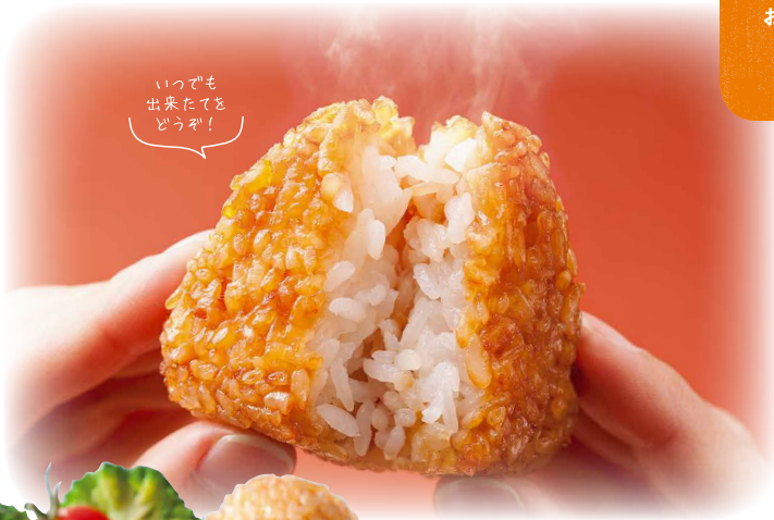
いつでも 出来たてを どうぞ!

米粒感を大切に炊き上げたあきたこまちを、ふんわり握ったようにおにぎりにして焼き上げた「CO・OP焼おにぎり」 小ぶりなので食べやすく、小さなお子さんから年配の方までおいしく召し上がっていただけます。