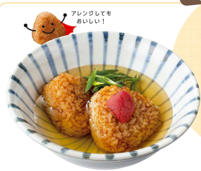
アレンジしても おいしい!

焼おにぎり4個を包装表記の通りに加熱し2個ずつ器に盛り、梅干し1個（種を除き2等分）、万能ねぎ（ななめ切り）を添える。だし汁240mlに、しょうゆ小さじ1/2、塩少々を加え加熱し、おにぎりにかける。お好みでおろしわさびを加えて。