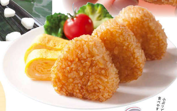
小ぶり 食べやすい 召し上がり