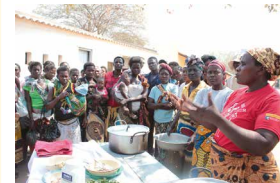
ボランティアによる栄養指導の様子。カロリーや栄養価の高い離乳食作りを母親たちに広めるため、住民から保健員やボランティアとなる人材を育成しました

5歳の誕生日を迎えられない子どもたちがいます。世界で5歳の誕生日を迎えない子どもたちは、年間およそ530万人。その半数以上300万人がアフリカの子どもたちです。その死因の多くは肺炎、下痢など。日本では予防や治療ができる病気で命を失ってしまうのは、多くの子どもが「栄養不良」で、体力がなく免疫力が弱いからです。栄養不良の原因は、食料が十分に得られないだけではありません。栄養や育児に関する知識が不足しているため、偏った食料しか使わなかったり、「赤ちゃんに母乳ではなく水を与える」といった古い慣習が根強く残っていたりするため、成長に必要な栄養素が足りず、多くの子どもたちが栄養不良に陥っているのです。 牛乳を飲むことが、子どもたちへの支援につながります。こうした状況の改善を願い、コープデリグループでは2008年度に「ハッピーミルクプロジェクト」を開始しました。牛乳の売り上げの一部をユニセフに寄付し、子どもたちの栄養改善につなげています。「子ども」「栄養」というキーワードを連想しやすく、多くの家庭で利用されている牛乳を通じた取り組みとすることで、より多くの方に世界の子どもたちが置かれていた状況や食料問題を知っていただきたいと考えています。 これまでアフリカ・モザンビーク共和国、シエラレオネ共和国を支援。今年度からは、コートジボワール共和国を支援します。さらにこれらの支援国に加え、2017年度からは災害などで苦しむアフリカ全土の子どもたちへも支援を広げています。 募金はユニセフの活動に役立てられます。西アフリカに位置するコートジボワールは、日本と同じくらいの面積を持つ人口2,500万人ほどの国です。カカオやコーヒーの生産で知られていますが、長期にわたった内戦の影響で子どもをめぐめる環境が悪化。約13人に1人の子どもが5歳を迎えることができず、年間7万人もの幼い命が失われているのです。子どもたちを守るためには、こうした状況を1日でも早く改善しなければなりません。 そのためプロジェクトでは、栄養不良を予防・軽減するためにユニセフが行うさまざまなプログラムをサポートしています。コープの牛乳を飲むことが、子どもたちの笑顔につながります。