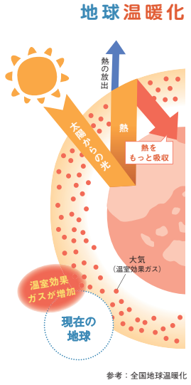
参考：全国地球温暖化