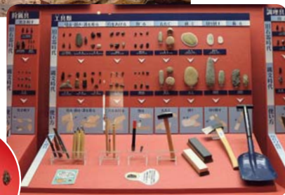
▼黒耀石のギャラリー