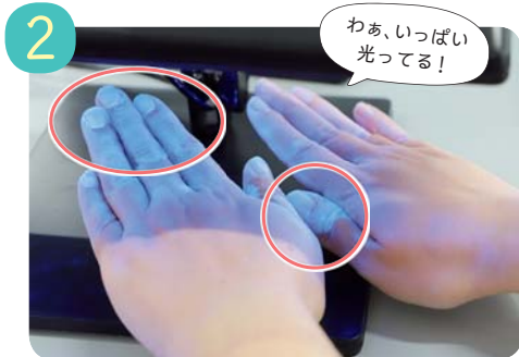
専用のライトを当てて確認。洗い残しの部分が白く光ります。特に爪の周り、関節のしわの部分が多く光っていました。