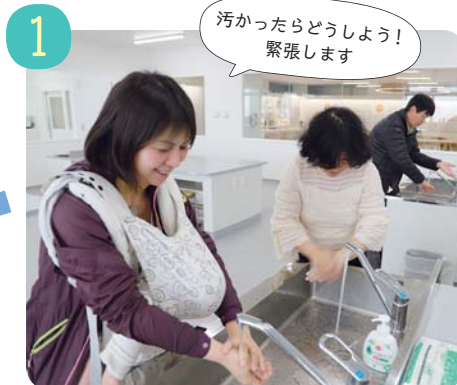
汚れに見立てた専用のローションを手に塗ってから、普段と同じように手を洗います。