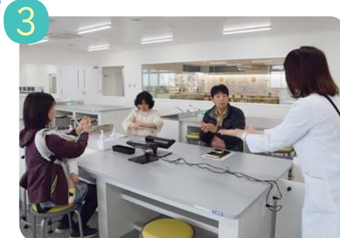
一人ひとり、どこを洗い残していたか確認。正しい手の洗い方を学んで再度手を洗い、今度はきれいに落ちました。