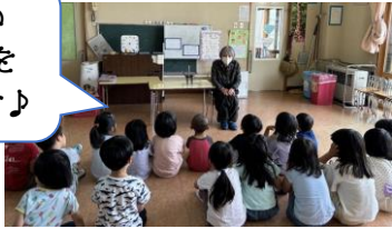
▲ねっこわあくさん 読み聞かせ活動中 みんな真剣に聞いているね★