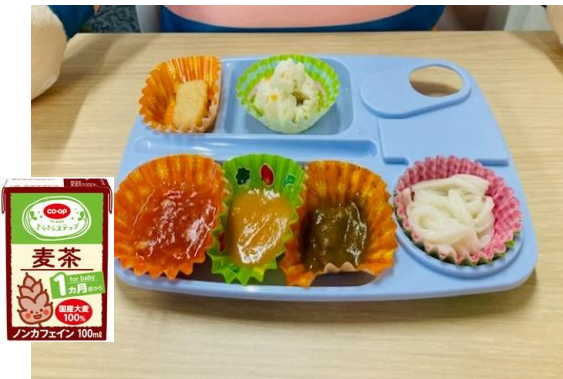
試食品の「きらきらステップ」シリーズの6品と麦茶

5カ月～3歳児の頃によくある悩みを少しでも解消し、子育てするママ・パパを応援したい♪そんな思いから「きらきらステップ」は作られました！