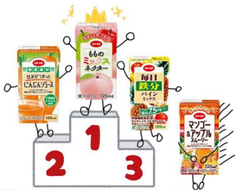
参加者の皆さんに人気だったのは…