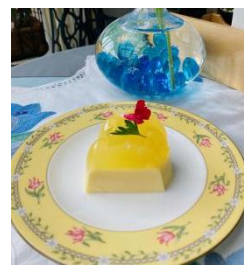
簡単おやつ二色ゼリー

コープながの Instagram ではコープのゼラチンを使ったゼリーのレシピをご紹介します！右上の二次元コードよりご覧ください。