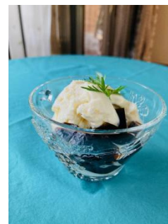
アイスコーヒーゼリー