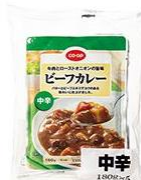
ビーフカレー中辛