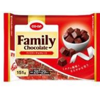
ファミリーチョコレート

生協では回収したペットボトルをCO・OP商品のパッケージの原料の一部として再利用する取り組みをすすめています。「CO・OP オムライス」、「CO・OP ビーフカレー」など、「ペットボトルから再生したフィルムを使用している包材」を使った商品を増やしていきます。