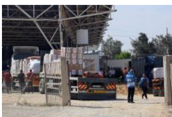
ユニセフは 10 月 21 日以来、エジプトから 386 台のトラックでガザ地区に物資を輸送。(1 月末時点)