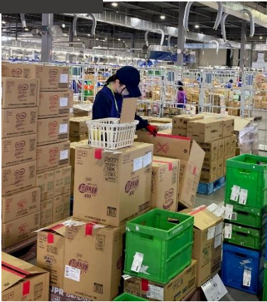
賞味期限、傷などを一つずつ人の目でチェック