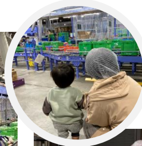
リサイクル品の回収もここで行っています