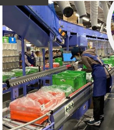
誘導ランプに従い、人の手で商品をコンテナにセット