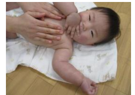
ベビーマッサージ