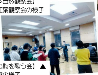
▲【望月の駒を歌う会】 練習の様子