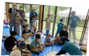
▲【天空の里いもい農場】 食育イベントの様子