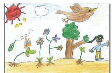
第31回通常総代会議案書表紙に掲載された作品