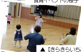
▲【きらきらいちご】 手遊びの様子

コープサークルは、子育てや商品・環境や福祉などくらしの関心ごとについて「やってみたい・学んでみたい」を形にして組合員が交流・活動する集まりです。コープサークルに登録し活動すると、コープから運営補助費が受けられます。組合員5人以上で「なにかやりたい！」と思ったら登録できます。詳しくは、下の二次元コードから、コープながののホームページをご覧ください。