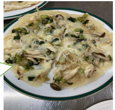
野菜としらすのピザ