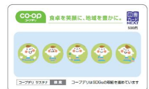
謝礼（画像はイメージです）

【申し込み・問い合わせ】コープながの総合企画室 0120-502477（月～金・9：00～17：45）