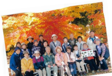
▲【松本自然観察会】 散策・紅葉観察会の様子