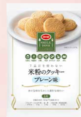
CO-OP 7品目を使わない 米粉のクッキー プレーン味 1個

※「ワン・モア・ライス」やってみた宣言」や「ワン・モア・ライス」アイデア」は何回でも投稿していただけますが、プレゼントの応募は期間中1人1口とさせていただきます。なお、プレゼント企画の対象は組合員とさせていただきます ※賞品の発送は11月中旬を予定しています。厳正な抽選により当選者を決定し、賞品の発送をもって発表にかえさせていただきます。 なお、抽選方法や当選についてのお問い合わせは受け付けておりません