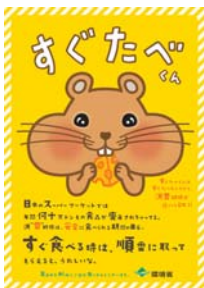
店舗に掲示したポスター

食品スーパーでは消費期限・賞味期限の短い順に食品を手前から陳列しています。コープでは、9〜10月に店頭や売場に環境省のポスターなどを掲示し、手前から順に手にとっていただけるよう呼びかけました。