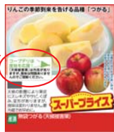
宅配カタログ誌面

コープデリは産地を応援！「天候被害果」は外見が劣りますが、食味は問題ありませんのでご理解ください。