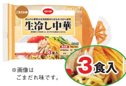
※画像はごまだれ味です。