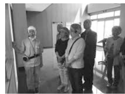
製造ラインに沿って見学しました。

油揚げを、地域の好みに合わせた味・形にして出荷しています。 関東・・・味が濃い目、大きさは普通サイズ 関西・・・だしの味が強め、三角の形をしたひと口サイズ (京都の舞妓さんが簡単に食べられるように) その他に、抹茶・りんご・ゆず・桜・生姜・黒糖などの味があり、 また海外向けの味付けをした商品も製造し、輸出しています。