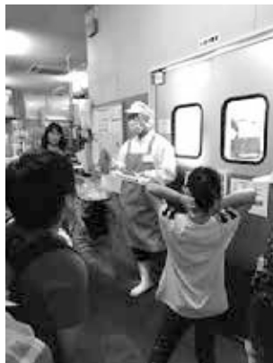
【写真右：水産加工室の入口前で、稲里店職員から説明を受ける参加者】

松代大本営地下壕見学のあと、コープ長野稲里店に立ち寄り、滅多に見られないバックヤードの見学を実施しました。商品として陳列するには、品温管理や細心の衛生管理などを徹底していることを学びました。またお店の入口の店頭では、食品トレイやペットボトルなどを回収し、リサイクルに取り組んでいることも伺いました。