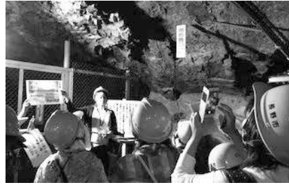
【写真上：壕内で見学している様子】