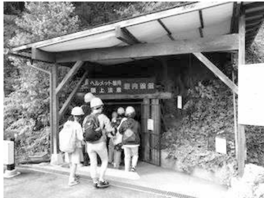
【写真上：恵明寺口から壕内に入る参加者】

松代大本営地下壕は、アジア太平洋戦争の末期、不利になってきた戦況の中、本土決戦に向けた準備のために、大本営・政府機関などを安全な場所に移す施設として、極秘に建設がすすめられました。組合員理事ガイドのもと、暗く、冷たい岩肌がむき出しの地下壕に入り、「地下壕の概要」「何故、松代が選ばれたのか」「沖縄戦との関係」などの説明がありました。