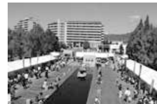
一昨年開催された エムウエーブの様子です!

長野県内の農協・生協・漁協・森林組合などの協同組合が主催し、行政の後援、諸団体の協力をいただいで開催するイベントです。 コープながのではお取引先や県内の諸団体と一緒に、たくさんの試食や商品の販売ブースを出展します。その他、楽しい企画が盛りだくさんです!ぜひ、ご家族でご来場くださいね!