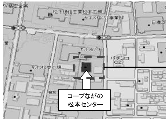
敷地内案内図 ※駐車場に係りの者がおります。指示に従って駐車してください。