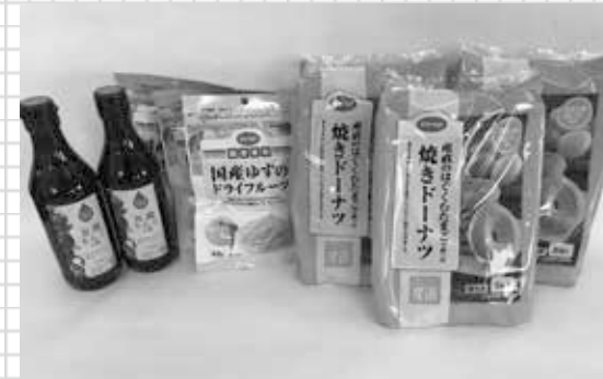
写真上：1月に福島へお送りした南信地域で製造されるお菓子など 右：お菓子と一緒に届けられた信州だより

被災地支援活動の内容と、東日本大震災復興支援募金についての詳細は、コープながののホームページをご覧ください。 http://nagano.coopnet.or.jp/